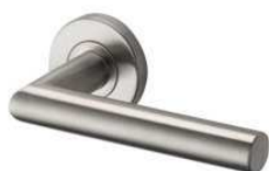
Pakket 1 – 201.01 Type Mood