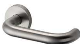
Pakket 3 – 201.02 Type World