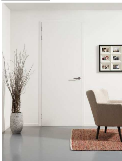
Opdekdeur zonder bovenlicht